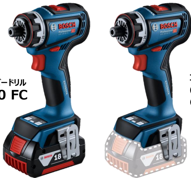
コードレスマルチドライバードリル GSR 18V-90 FC