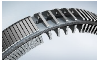
Double Loopset Belt