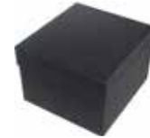
ブラック ボックス