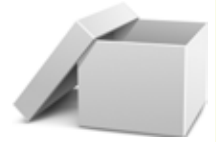
ホワイト ボックス