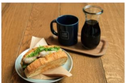
「フランコニア」800円とオリジナルブレンド