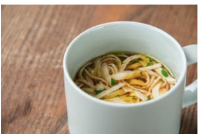
「クレープ入りスープ」550円