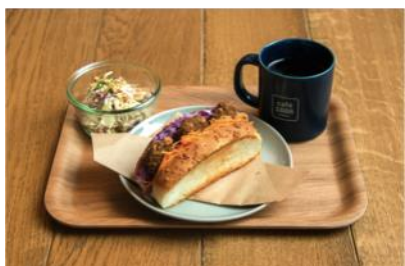
「ファラフェル」700円・ドリンクサラダセット400円