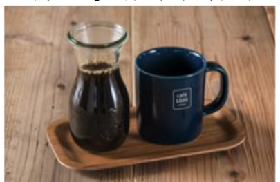
「カフェ 1886 アット ボッシュブレンド」400円～