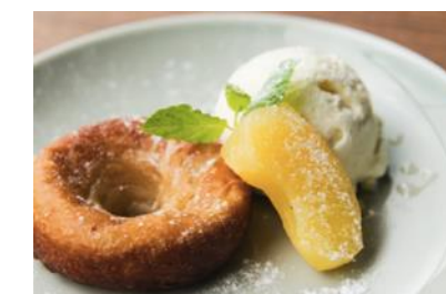
「ベイクドアップルドーナツ&バニラアイス」650円