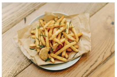
「ハーブフレーバーフライドポテト」650円