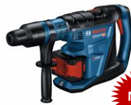
GBH 18V-40C GBH 18V-40CH(本体のみ)