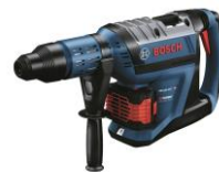
GBH 18V-45C GBH 18V-45CH(本体のみ)