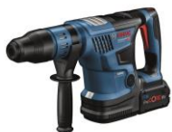
GBH 18V-36C GBH 18V-36CH(本体のみ)