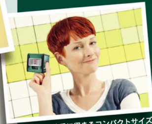
●片手に収まるコンパクトサイズ

安全上のご注意 ご使用前に「取扱説明書」をよくお読みの上、正しくお使いください。